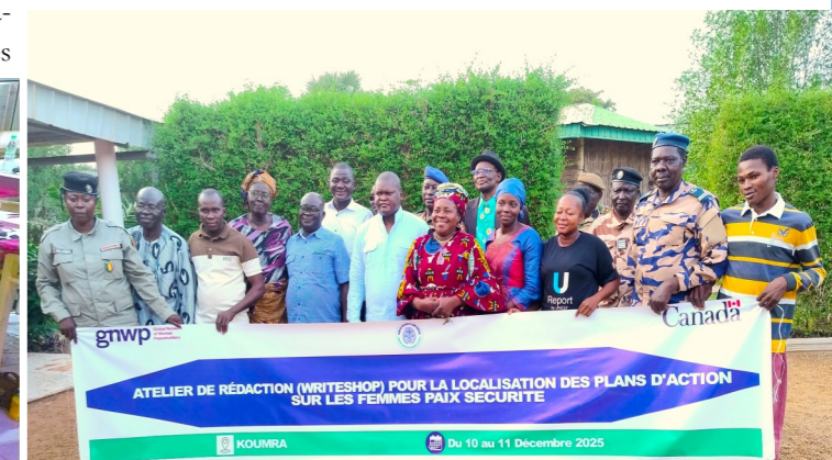
Séance de formation des Parajuriste à N'Djaména.

Au terme des travaux, plusieurs résultats majeurs ont été enregistrés : le renforcement des capacités des participants sur l'agenda FPS ; l'élaboration participative d'un projet de Plan d'Action Local (PAL) ; la production d'un document d'orientation pour l'intégration des FPS dans le plan de développement local ; un engagement renforcé et une compréhension commune des rôles et responsabilités de chaque acteur dans la mise en œuvre et le suivi du futur projet d'appui local.