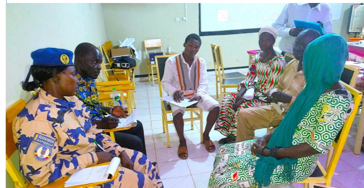
Travail en groupe lors de l'atelier de Localisation.

de création et de fonctionnement. C'est au total 30 participants qui ont été sensibilisés aux résolutions FPS.