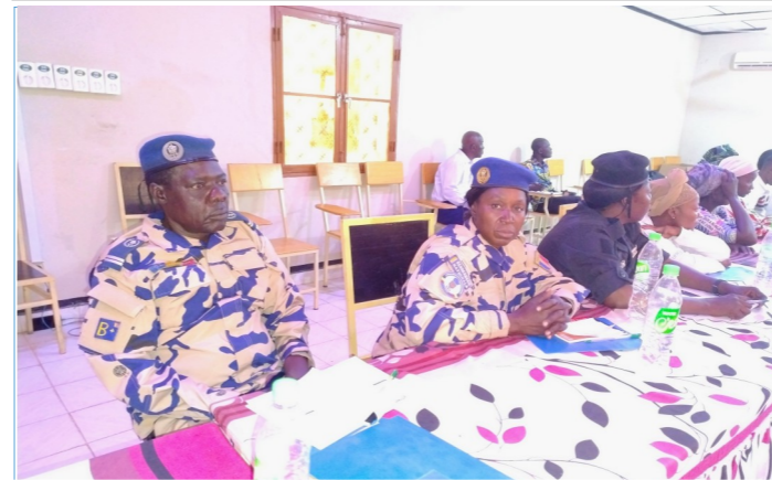
Séance d'atelier de localisation des Résolutions 1325 et 2250 à Koumra.